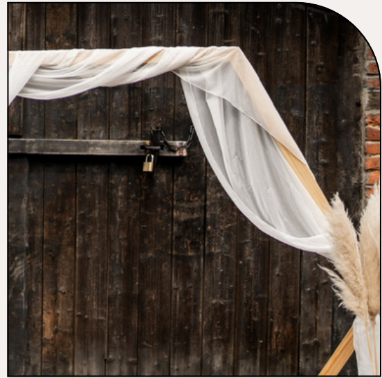
STOFFLÄUFER FÜR TRAUBOGEN

Der Stoffläufer lässt sich wunderschön um den Traubogen drapieren und verleiht eurer Zeremonie eine romantische, verspielte Note.