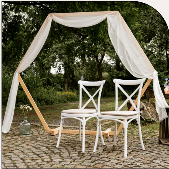
TRAUBOGEN / BACKDROP "HEXAGON"

Moderner Blickfang für eure Trauung: Der Traubogen aus Holz ist leicht transportierbar und im Handumdrehen aufgebaut.